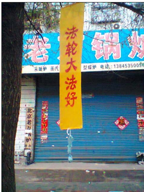
左上：河南省“天灾中共 三退保命” 左下：黑龙江牡丹江市“法办周永康” 中上：黑龙江牡丹江市“法轮大法好” 右上：东北某市城乡“普天同庆法轮大法弘传二十周年” 右下：广东梅州“世界需要真善忍”