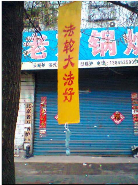
左上：河南省“天灾中共 三退保命” 左下：黑龙江牡丹江市“法办周永康” 中上：黑龙江牡丹江市“法轮大法好” 右上：东北某市城乡“普天同庆法轮大法弘传二十周年” 右下：广东梅州“世界需要真善忍”