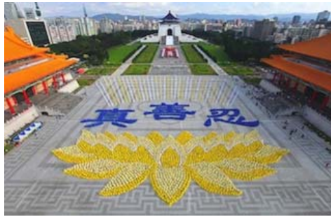
图：2010 年 11 月约 6000 名法轮功学员在台湾排出莲花图形与“真善忍”。

“真、善、忍”真正地唤起了人们心中的佛性，即使在遭受迫害的十多年中，法轮功学员在自身遭受巨大苦难的同时，始终坚持和平反迫害，向民众讲清真相，实践着“真、善、忍”。