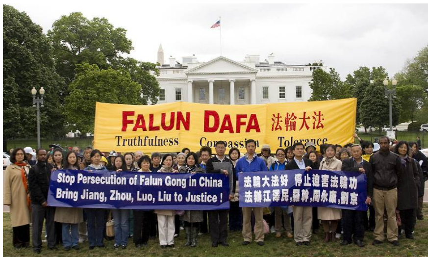
海外法轮功学员在大使馆前请愿，并呼吁停止迫害。

1999年，江泽民一手挑起对法轮功的迫害，灭绝人性地对法轮功学员施行“名誉上搞臭、经济上搞垮、肉体上消灭”的政策。目前至少3551人被迫害致死，6000多人被非法判刑，十几万人被非法劳教，数十万人被拘留、被绑架到各地洗脑班迫害。更有无法计数的法轮功学员被中共秘密活摘器官，牟取暴利，再被焚尸灭迹。十余年来，这场迫害被国际社会称为“21世纪最大的人权灾难”、“这个星球上从未有过的罪恶”。