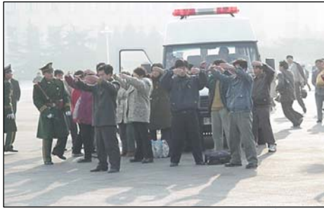
1999年11月16日，十几名法轮功学员冒着生命危险，以炼功形式在天安门广场和平请愿，遭非法拘捕。

打、折磨死修炼人的所谓“执法人员”，难道会对其他民众大发善心？老百姓说“如今土匪在公安”，在土匪背后撑腰的，是中共指挥迫害法轮功的政法委和“六一零”（专门迫害法轮功的非法机构）。