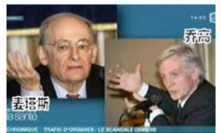
视频截图：2010年1月7日，收视率很高的法国电视5台专题报道，揭露中共活体摘取大量法轮功学员器官进行贩卖的罪行。