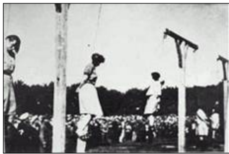
上图：纽伦堡国际法庭认定纳粹集中营“死亡护士组”迫害犹太人的罪行后，于1946年对“奉命行事”的护士执行死刑。

追查中，而你现在迫害法轮功的每一件“政绩”都将成为明天受审判的证据。近几年，全国各地参与迫害法轮功的“六一零”、公检法、各政府部门人员所谓“因公殉职”和意外死亡率远远高于过去。