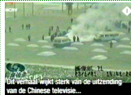
图：荷兰国家电视一台 2005 年 3 月 14 日《时事评论》专题播放法轮功节目，并揭露江氏集团导演的“自焚”伪案，质疑突发事件中两辆警车为何备有（据中共媒体报导）20 多个灭火器。而且一名叫王进东的男子浑身烧黑，两腿间盛汽油的塑料雪碧瓶却在火中不燃烧不变形，是自焚还是拍戏？

真相时，于二零一二年二月二十九日遭赤峰松山区恶警绑架。女儿杨丽荣（四十多岁）也被绑架。恶警去李玉芝家非法抄家，从李玉芝家抄走电脑、打印机等私人物品，还抢走了三万两千元现金，连接收卫星电视的小锅也被抄。◇