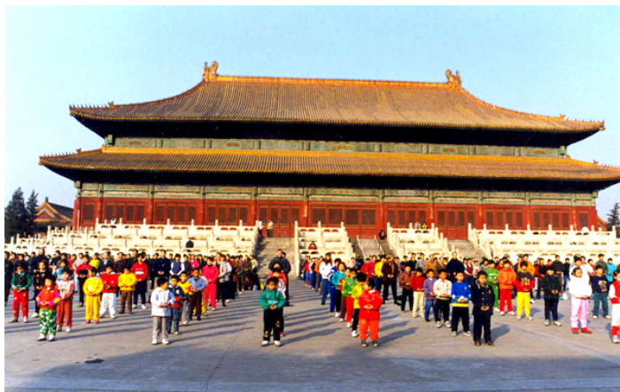
98年9月北京法轮大法修炼心得交流会期间集体炼功

在我们大院还发生过一件事，人人皆知，也令人感叹不已。大院有一人开着残疾车，在马路边上行驶时，不