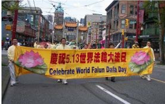
温哥华法轮功学员游行庆祝大法弘传二十周年

当日多伦多晴空万里，游行队伍由一百多人组成的天国乐团打头阵，乐团成员一路高奏《送宝》、《法鼓法号震十方》、《法正乾坤》，庄严雄壮的鼓乐驱散了层层阴霾，随后而来的是“大法船”花车和手