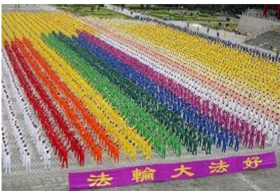
七千多人在台北自由广场大炼功

（明慧记者刘文新、方慧台湾台北报道）为欢庆即将到来的“五一三世界法轮大法日”，台湾法轮功学员于二零一二年四月二十九日在台北自由广场汇集七千多位学员恭排慈悲伟大的师尊李洪志先生法