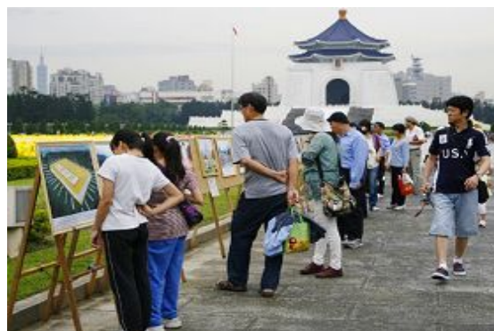
许多路过遊客围观在法轮功真相图片展前

（明慧记者刘文新、方慧台湾台北报道）为欢庆即将到来的“五一三世界法轮大法日”，台湾法轮功学员于二零一二年四月二十九日在台北自由广场汇集七千多位学员恭排慈悲伟大的师尊李洪志先生法