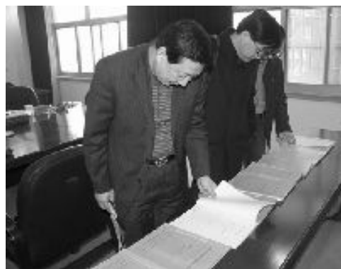
四川省综治办副主任崔均

花季少年热爱祖国，然而我的外婆、三外公、五外婆、五外公他们却都是在我妈妈和小嬢被抓走后，在害怕与惊吓中去世。我不知道我的同龄、同学中还有多少人有这样的遭遇！我现在面临高考，学习费用、生活费用、房租费用，我想去新津成都市法制教育中心见见妈妈，问一下需要多少，该怎么办。然而现实是残酷的，即使有街道办的叔叔陪着去了，也没有见到人。以前，曾经看到在自行车筐筐里放的一些纸张上写着：新津成都市法制教育中心毒害死了什么人，谁谁谁又遭到酷刑折磨。我不知道那里是不是一个什么特别