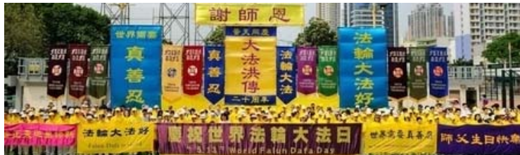
图：香港法轮功学员在 6 日举行盛大的庆祝法轮大法弘传二十周年及世界法轮大法日的集会和游行，游行的壮观场面震撼许多中港民众，他们纷纷赞颂法轮大法的美好及斥责中共对法轮功的迫害。

翻墙看世界 外面更精彩：用海外电子信箱给 freeget.ip@gmail.com 发电子邮件，10 分钟内会拿到几个 IP 地址。突破网络封锁，访问明慧网 www.minghui.org 了解更多真相！在动态网主页上请下载自由门、无界等各种“翻墙”软件，以后上网更方便。