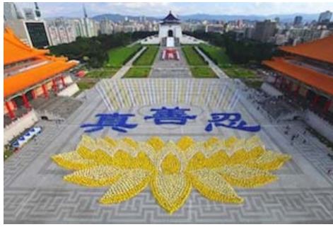
图：2010 年 11 月约 6000 名法轮功学员在台湾排出莲花图形与“真善忍”。

社会主义国家的解体都印证着同一个真理：独裁的政权和强大的军警力量都不是维系社会稳定的根本，只有纯朴的民风和高尚的道德哺育出的善良的民心才是社会稳定和发展的基石。