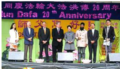
图：加拿大的三级政府官员及代表到庆祝法轮大法传世二十周年现场祝贺，并一起用中文及英文高呼“法轮大法好”。