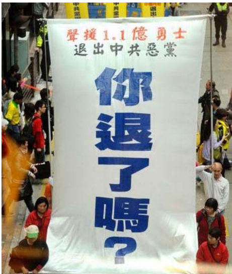
图：香港声援一亿一千万同胞三退

自二零零四年底《九评共产党》发表以来，很快即掀起了三退大潮。中共六十多年来给中华民族带来的深重灾难，虐杀了八千多万炎黄子孙，尤其是近十几年来残酷迫害法轮功，诋毁对“真、善、忍”的信仰，摧毁中国人的道德基石，带来了种种难以解决的社会问题。了解了这些，破除了党文化，明智的人们纷纷抛弃中共。