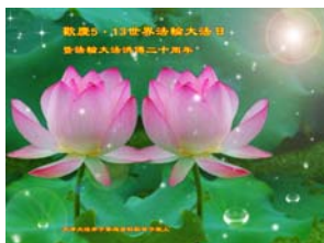
图：中国大陆的法轮大法弟子向明慧网寄贺卡贺词庆祝大法弘传二十周年和“世界法轮大法日”。

法轮功也称法轮大法，是由李洪志先生于一九九二年五月十三日从中国公开向社会传出，强调以“真、善、忍”的法理为指导，要求炼功者提高道德水准。五套功法简单易学，祛病健身功效卓著。目前，法轮大法已弘扬世界五大洲一百多个国家，获各国政府、团体颁予一千六百多项褒奖和支持。从二零零零年起，五月十三日被定为“世界法轮大法日”。每年的五月，全世界法轮功学员和明白真相的世人都以各种形式欢庆节日，庆祝大法弘传于世间。