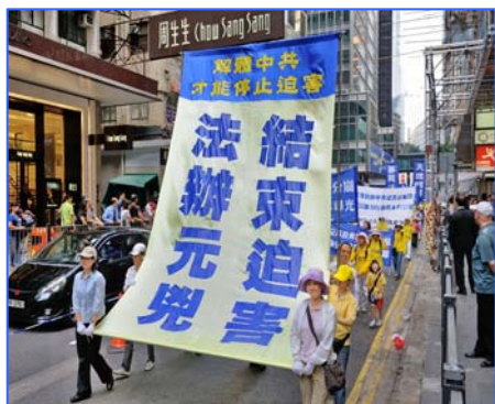
图：香港法轮功学员与支持团体于二零一二年四月二十二日以“结束迫害法办元凶”为主题，举行盛大的反迫害集会游行。

迫害好人必遭天谴，更何况是迫害修炼法轮大法的修炼人。即使这样，法轮功学员仍然慈悲的告诫那些参与迫害的中共执法人员，善待大法及法轮功学员，选择好的未来，佛法是慈悲的，但威严同在。◇