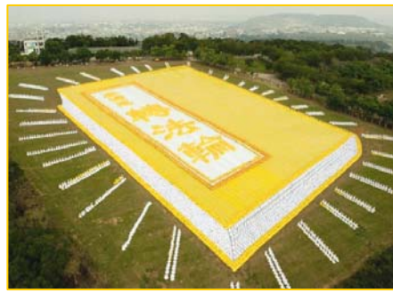
■ 2009 年 11 月 21 日，台湾六千名法轮功学员将指导修炼的《转法轮》排成金光灿烂的立体书。

国际社会鉴于李洪志师父和法轮大法对人类身心健康作出的杰出贡献，纷纷颁发各项褒奖。迄今（二零一二年五月）各界颁与的各类褒奖合计一千七百多个，通过支援的决议案共三百多项，支援信函累计超过一千二百封。