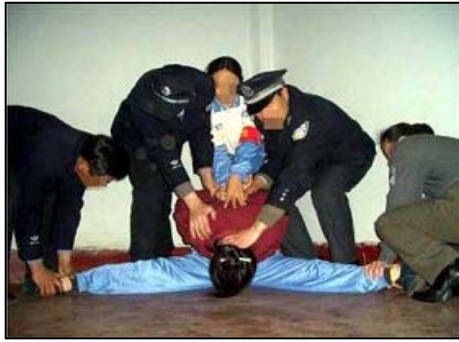
劈腿:强行将受害者双腿一字劈开