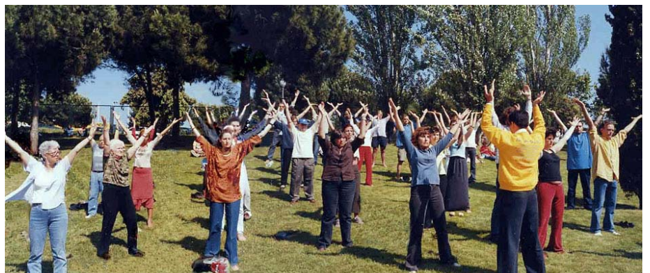
在西班牙全国健康博览会上，参观者前来学习法轮功

在亚洲、非洲、澳洲、欧洲、北美和南美洲的一百二十多个国家中，有一亿多人修炼法轮大法。在新泽西州，有一千多人修炼这个改善身心的功法。法轮大法已经在美国和世界各地帮助众多的人们改善了健康，净化了思想，提升了精神境界，而且提升了做人的品格。