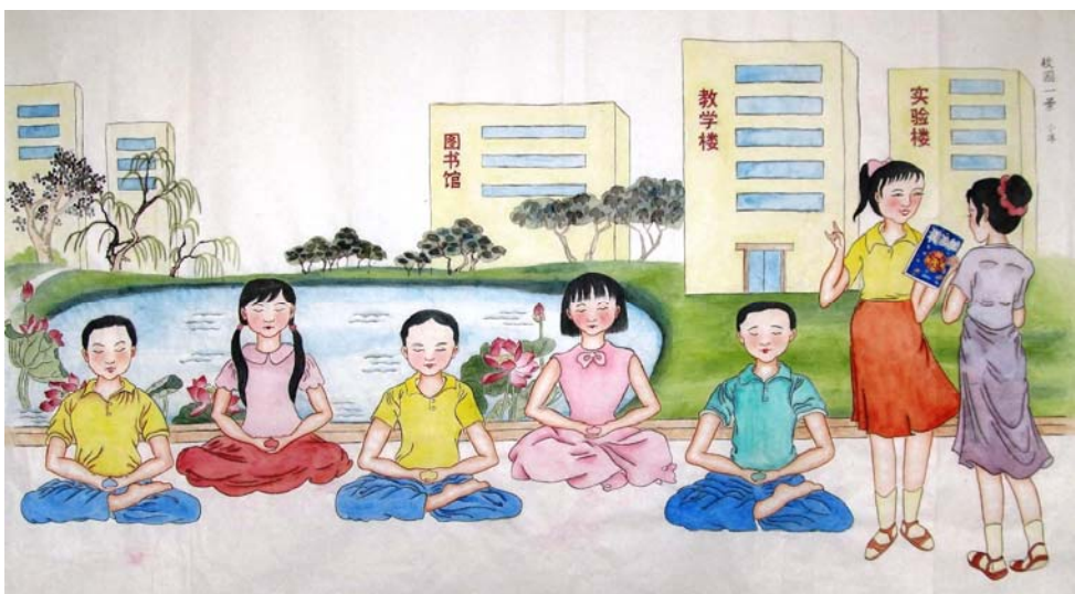
工笔画：校园一景（作者：中国大陆 小淳）

我带孩子成长的事很多，今天只写出其中一二。从带孩子走过来的路上，我真切体会到，用法轮大法“真善忍”的理念来教育孩子、开导孩子，真的是一条充满希望和喜悦的金光大道，能把孩子教育成德艺双馨、身心健康的有用之人。（文／大陆大法弟子）◇