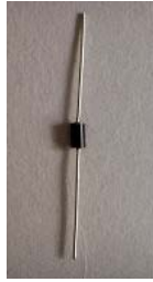
奴工产品图：被搓直的二极管

法轮功学员每周要搓三、四十箱，每箱十几公斤。法轮功学员早上搓二极管，上午被强制上课洗脑，下午、晚上搓到九点多钟才让睡觉。每年被强迫给恶警创益三万元左右。