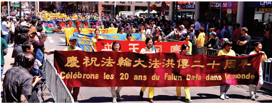
图：二零一二年五月十二日，纽约七千人游行庆大法弘传二十周年。