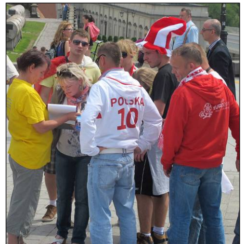
游客和各国球迷签名反对中共迫害

◎二零零零年的腊月，湖北浠水某地，几天大雨使清港的泥巴堵塞了通向集市的要道，无法通行，但没有人管。一位七十多岁的法轮功学员看到后，自己拿来铁锹，一锹锹地将泥巴挪到港边的岸上，干得大冬天脱了棉衣还浑身是汗。（接下页）