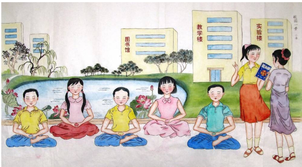
工笔画：校园一景（作者：中国大陆 小淳）

我带孩子成长的事很多，今天只写出其中一二。从带孩子走过来的路上，我真切体会到，用法轮大法“真善忍”的理念来教育孩子、开导孩子，真的是一条充满希望和喜悦的金光大道，能把孩子教育成德艺双馨、身心健康的有用之人。（文／大陆大法弟子）◇