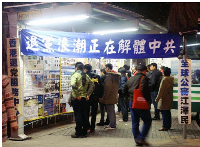
大陆中国游客在香港金紫荆观看法轮功真相看板

他说，来香港购物，其实最吸引人的是那些大陆禁书，这对国内人太具有吸引力了。大街小巷的书摊上，可淘的宝不少，这些反共杂志就在马路边的书摊上摆着，忍不住买了一摞。里面的话题都不错，特让人感兴趣。问他带回来了？他有点得意，说那当然了。提到当时买书的时候，团友拦他怕惹麻烦。导游带着购物，也在旁边看着呢。他冲导游说：“没人举报就没事，导游，是吧？”导游说：“我没看见，我不知道。”这不就带回来了。现