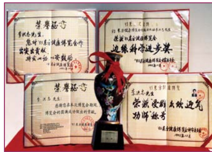
■ 李洪志大师荣获1993年健康博览会“边缘科学进步奖”和“受群众欢迎气功师”称号

● 法轮大法弘传世界 法轮功至今已弘传一百多个国家和地区，受到世界人民的爱戴和尊敬。李洪志先生和法轮大法因对人类身心健康做出的杰出贡献，获各国政府褒奖、支持议案和信函3000多项。法轮功书籍被译成30多种语言，在全球出版发行，并可在网上免费下载。