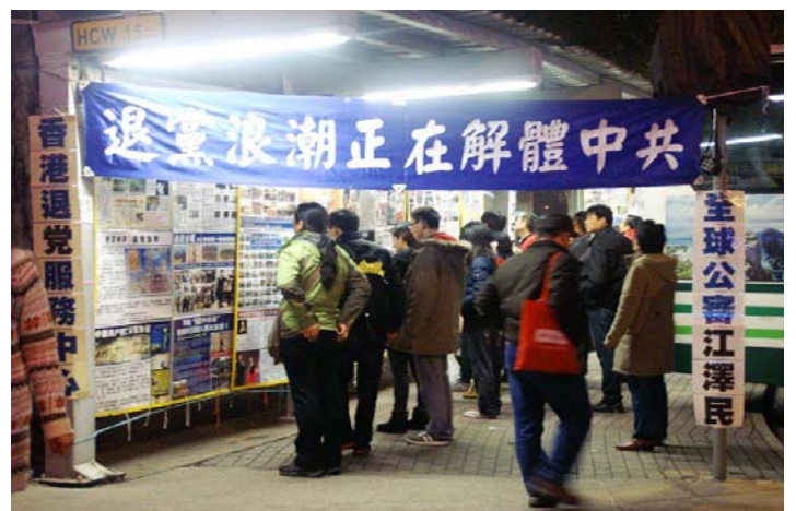
大陆中国游客在香港金紫荆观看法轮功真相看板

他说，来香港购物，其实最吸引人的是那些大陆禁书，这对国内人太具有吸引力了。大街小巷的书摊上，可淘的宝不少，这些反共杂志就在马路边的书摊上摆着，忍不住买了一摞。里面的话题都不错，特让人感兴趣。问他带回来了？他有点得意，说那当然了。提到当时买书的时候，团友拦他怕惹麻烦。导游带着购物，也在旁边看着呢。他冲导游说：“没人举报就没事，导游，是