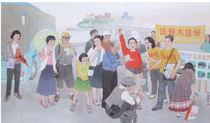
工笔画：发自内心的呼声

有一天，在卢塞恩湖边，从一辆旅游大客车上下来的全是中国大陆游客。大法弟子热情迎上去，送上《九评》和真相材料，这时一位游客突然响亮地发出了“法轮大法好”的呼声，随后也有别的同车游客跟着喊，在“法轮大法好”的呼喊声中，全车的游客几乎都接受了真相材料