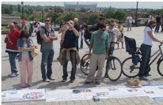
▲游客观看真相条幅

八日早晨，法轮功学员在古城广场上打开真相横幅，二十几米的真相条幅铺在地上，立即引来众多观众和媒体的注意。很多人围着法轮功学员听真