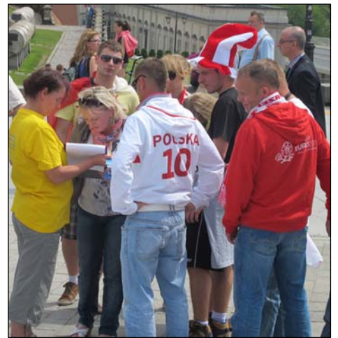
游客和各国球迷签名反对中共迫害

在人群中也可以看见中国出访欧锦赛的记者和旅游同胞，他们拍照下“法轮大法好”条幅，也拍下法轮功学员受迫害的照片。法轮功学员给他们讲真相、分发《九评共产党》，告诉他们法轮功已弘传一百多个国家，“天安门自焚”是中共专门制作的造假诬陷，希望他们在波兰期间能多上网了解法轮功真相，并把真相带给自己的亲朋好友。