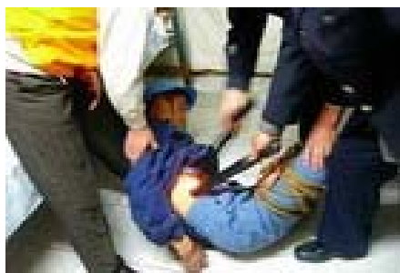
演示法轮功学员遭迫害

目前,吉林市沙河子洗脑班、辽源市看守所洗脑班、延边二道白河洗脑班、图们松林养老院洗脑班、伊通县洗脑班、四平警察培训学校洗脑班等各地中共洗脑班都非法关押着诸多被抓捕的法轮功学员。◇