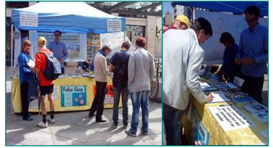
给行人讲真相、民众签字支持反迫害

二零零一年一月二十三日，天安门自焚案震惊中外。随后，自焚伪案的多处造假之处被曝光，揭示中共导演自焚是为了煽动民众的仇恨，为迫害法轮功制造借口。“天安门自焚”伪案 CCTV 专题节目制片人是陈虻。在制作此节目后的 10 月，陈虻就升任《东方时空》主管。不过这些晋升都是建立在出卖良知的基础上。正如 2001 年他在美国加州一个研讨会上所说，“新闻在我看来并没有什么真实性”，“谁给我饭吃，我就给谁卖命。”他真地应了自己的话。2008 年初，陈虻患胃癌，后转移到肝部，2008 年 12 月在痛苦中死去，年 47 岁。中共在迫害法轮功的十三年中，不讲法律，邪恶手段用尽。自古道，善有善报，恶有恶报。正所谓：人在做，天在看。◇