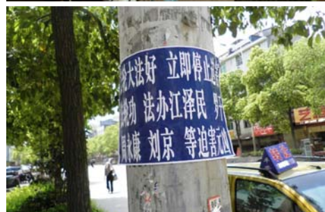
大陆出现法办迫害元凶条幅、不干胶