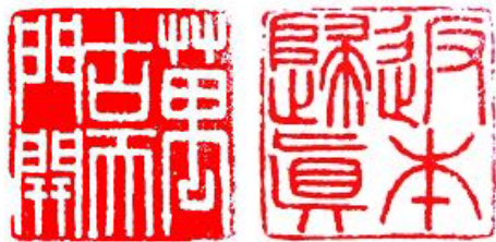
篆刻：万古天门开、返本归真

我凭着一颗人的良心，年复一年，日复一日，把大法真相材料、小册子、光盘等，送到千家万户。希望人们不被谎言欺骗，有一个美好的未来。（文／沈阳大法弟子 朝真）◇