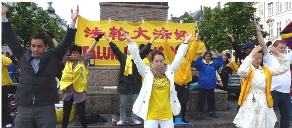
图：法轮功学员在议会大厦附近的高桥广场炼功呼吁反迫害