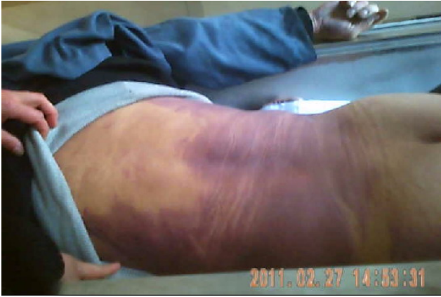
秦月明满身伤痕的遗体