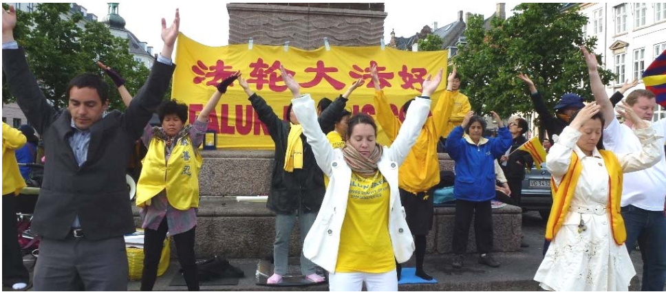
图：法轮功学员在议会大厦附近的高桥广场炼功呼吁反迫害