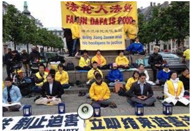
法轮功学员的和平请愿

丹麦电视台 TV2 来到现场, 报道法轮功学员的和平请愿画面。看着在宁静中打坐的法轮功学员们, 电视台