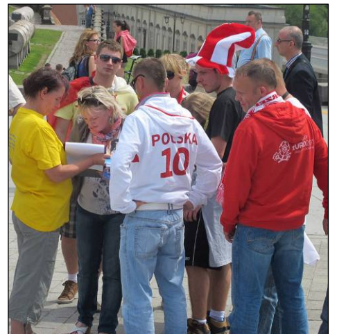
游客和各国球迷签名反对中共迫害

◎二零零零年的腊月，湖北浠水某地，几天大雨使清港的泥巴堵塞了通向集市的要道，无法通行，但没有人管。一位七十多岁的法轮功学员看到后，自己拿来铁锹，一锹锹地将泥巴挪到港边的岸上，干得大冬天脱了棉衣还浑身是汗。（接下页）