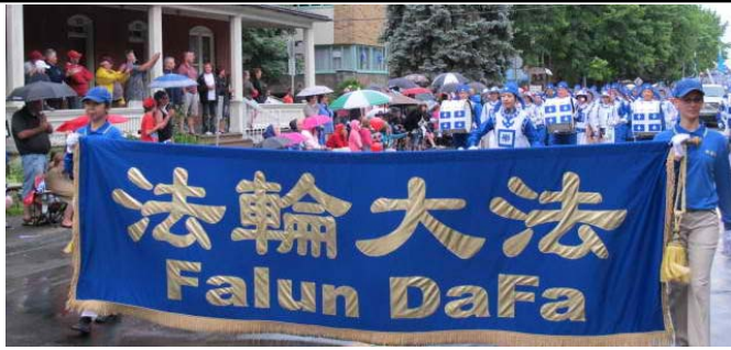
左图：天国乐团参加二零一二年魁省省庆游行