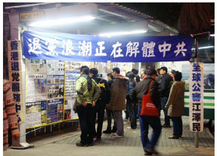
大陆中国游客在香港金紫荆观看法轮功真相看板

他说, 来香港购物, 其实最吸引人的是那些大陆禁书, 这对国内人太具有吸引力了。大街小巷的书摊上, 可淘的宝不少, 这些反共杂志就在马路边的书摊上摆着, 忍不住买了一摞。里面的话题都不错, 特让人感兴趣。问他带回来了? 他有点得意, 说那当然了。提到当时买书的时候, 团友拦他怕惹麻烦。导游带着购物, 也在旁边看着呢。他冲导游说: “没人举报就没事, 导游, 是吧?” 导游说: “我没看见, 我不知道。”这不就带回