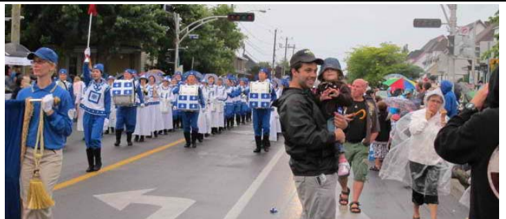
右图：观众与天国乐团合影留念