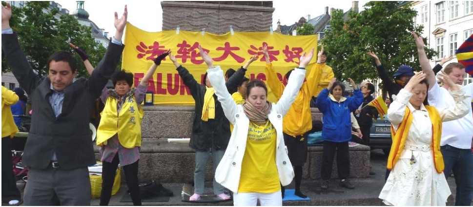
图：法轮功学员在议会大厦附近的高桥广场炼功呼吁反迫害