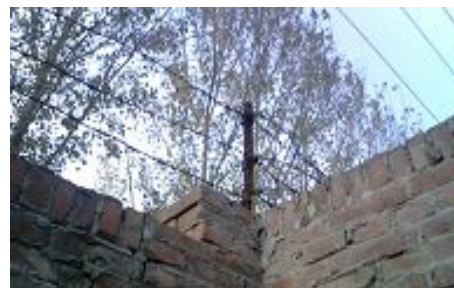
带铁丝网的洗脑班高围墙

洗脑班搬迁至后再没挪过地方，不知有多少法轮功学员在那个洗脑班遭受过惨无人道的迫害，“六一零”在那个黑窝对法轮功学员的摧残还在进行中。在此奉劝那些“六一零”的工作人员抓紧悬崖勒马，目前，迫害法轮功的恶徒王立军、薄熙来之流正在被清算，中共高层都在想方设法擦净自己因迫害法轮功而沾染的血迹，你们都好自为之吧！