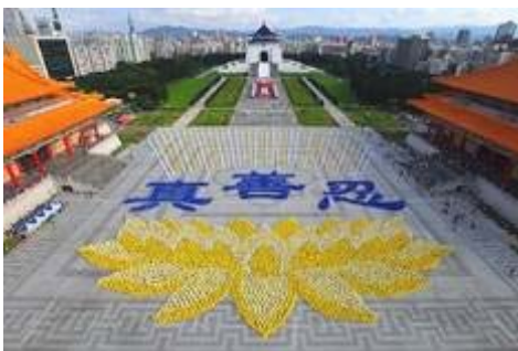
图：2010 年 11 月约 6000 名法轮功学员在台湾排出莲花图形与“真善忍”。

社会主义国家的解体都印证着同一个真理：独裁的政权和强大的军警力量都不是维系社会稳定的根本，只有纯朴的民风和高尚的道德哺育出的善良的民心才是社会稳定和发展的基石。