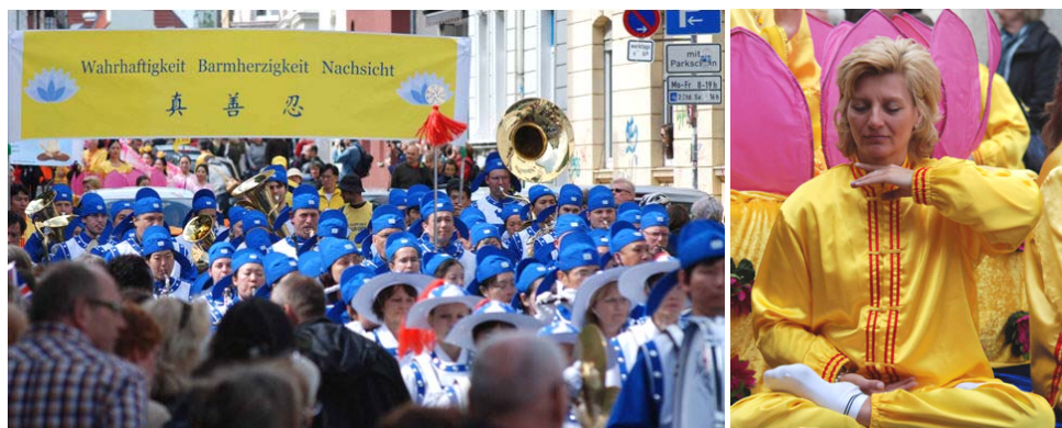
图：由法轮功学员组成的欧洲天国乐团。 右图：演示法轮功第五套功法。

（明慧记者雪莉德国报道）二零一二年六月二日，法轮功学员在比勒菲尔德参加了一年一度的多元文化节大游行。天国乐团、花车和扇子舞队受到十万观众的热情欢迎，所到之处喝彩声、掌声接连不断。