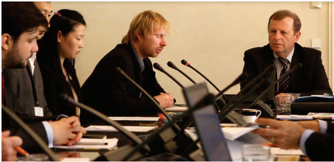
捷克参议院教育、科学、文化、请愿和人权委员会举行会议，讨论关于结束在中国迫害法轮功的提案

【明慧网二零一二年五月二十五日】二零一二年五月二十三日，捷克参议院教育、科学、文化、请愿和人权委员会讨论了关于结束在中国迫害法轮功的提案，在场的成员一致支持制止迫害法轮功，并做出了决捷克参议院教育、科学、文化、请愿和人权委员会主席、哲学博士亚罗米尔·耶勒马什当