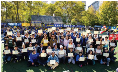
2011年10月16日，美国纽约声援一亿四百万中国人三退，41位来自中国大陆人士现场退出中共组织。

中国人在加入少先队、共青团、共产党时，都宣誓要为其奋斗一生，献出生命，这等于是发了一个毒誓，如果不退出，就是中共的一份子，就要分担它的罪恶的恶果，就会在天灭中共的天象变化中遭劫难。“三退”就是为了取消当初发下的毒誓，避免在天灭中共时为其陪葬的命运。愿您早“三退”，愿您和家人有幸福美好的未来！◇