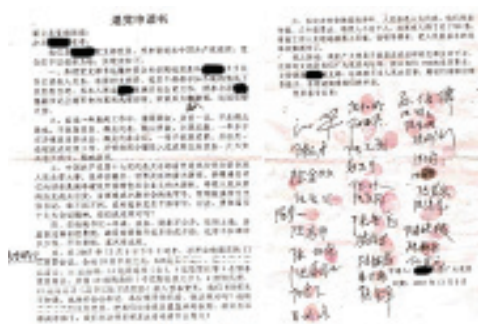
图：灌云县乡村民众退党申请书

部和职员退党声明。比如，中央电视台的记者写道：“够了。今天我正式声明脱离和它们的一切关系。我曾是电视台的一名记者，多年的工作中，看透了它们的虚伪。”“在谎言的宣传下曾被该党欺骗，今天我正式声明脱离和它们的一切关系。”