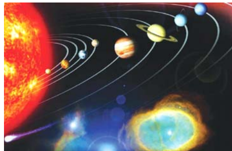
图：精美的太阳系是偶然形成的吗？

牛顿还曾以一个小例子，说服了不信神的朋友。牛顿的一位不相信有神存在的好友到牛顿家做客，见到牛顿家里有一具精美的太阳系模型。只要摇动曲柄，众星球就各按其轨道运转起来。他问牛顿，这模型是哪一位能工巧匠设计、制作的。牛顿回答说：“没有人。”他的朋友不解：“这么精巧的装置，怎么会没有人呢？”牛顿回道：“如果一具模型必须有人设计、制作的话，为什么象这具模型这样实际运转着的太阳系却会是偶然