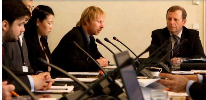
人权委员会讨论关于结束在中国迫害法轮功的提案

下一步该人权委员会将和议会外交、国防和安全委员会共同探讨停止迫害的提案，并把这次决定知会捷克参议院主席、政府总理、捷克共和国总统和中共驻捷克大使。