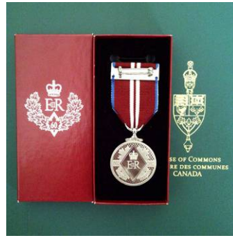
英国女王伊丽莎白二世钻石纪念奖章

江泽民流氓集团对法轮功长达十三年的迫害，对中国社会的全面打击和伤害是无法计量的。法律人权的践踏、道德伦理的沦丧、国民经济的巨耗、优秀人才的摧残，中共血债派让整个国家和民族背负了沉重的代价。正邪如冰炭，三百村