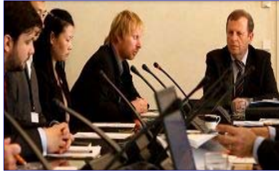
捷克参议院教育、科学、文化、请愿和人权委员会举行会议，讨论关于结束在中国迫害法轮功的提案。