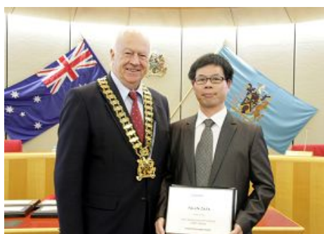
市长在会议上为法轮功团体代表颁奖

（明慧记者蕴韵澳洲悉尼报道）二零一二年六月二十七日晚七点，澳洲悉尼布莱克镇（Blacktown City）市政府为当地节日大游行获奖团体举行颁奖仪式，法轮功团体和法轮功学员组成的天国乐团已是第三次获得冠军。