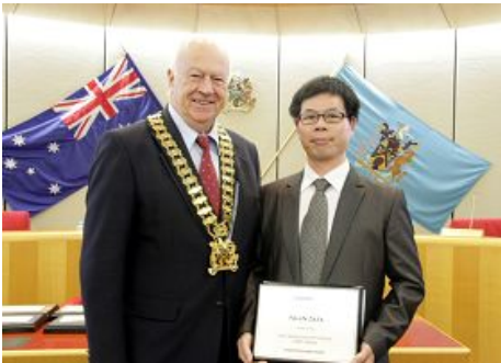
市长在会议上为法轮功团体代表颁奖

（明慧记者蕴韵澳洲悉尼报道）二零一二年六月二十七日晚七点，澳洲悉尼布莱克镇（Blacktown City）市政府为当地节日大游行获奖团体举行颁奖仪式，法轮功团体和法轮功学员组成的天国乐团已是第三次获得冠军。