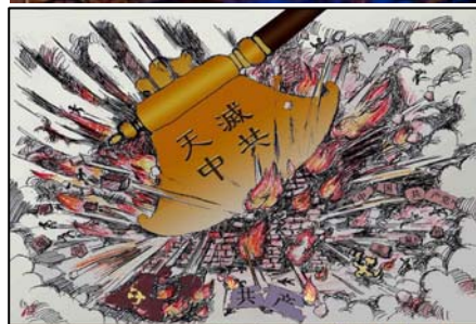
漫画：《珍惜生命 远离中共》