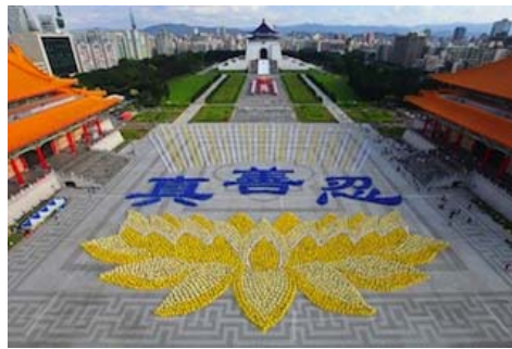
图: 2010 年 11 月约 6000 名法轮功学员在台湾排出莲花图形与“真善忍”。

会主义国家的解体都印证着同一个真理:独裁的政权和强大的军警力量都不是维系社会稳定的根本,只有纯朴的民风和高尚的道德哺育出的善良的民心才是社会稳定和发展的基石。