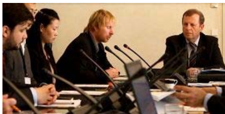
捷克参议院人权委员会决议：制止迫害法轮功

这说明中共迫害修炼“真、善、忍”的法轮功学员，早已失去民心。大批村民选择支持无辜受迫害的法轮功学员，是中国民众面对暴政，挺身选择正义的壮举，也是民众无惧政法委的打压，良心觉醒的开始。