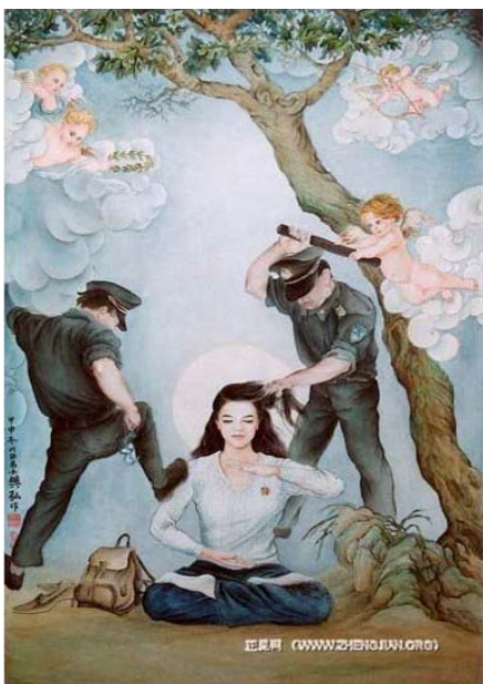
■“真善忍”国际美展作品《金刚不动》

我们不能承认邪恶的旧势力强加给大法的迫害，所以，我们要整体配合，继续加大力度发正念，拧成一股劲，彻底捣毁集中在丹东地区迫害法轮功学员的烂鬼和邪党因素，彻底否定邪恶的迫害，把法轮功学员营救出来。◇