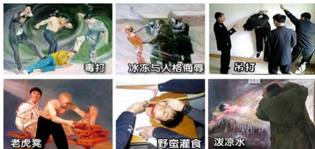
法轮功学员遭受的部分酷刑

名义上“610”是政府下属的一个办公室，可它并不是隶行政府职能的机构，干的是非法限定人身自由、劫持关押公民、指挥公安、安全局监听、监控、秘密绑架法轮功学员，干涉法律公正、强制洗脑、实施暴力、非法入侵民宅、策划恐怖行为、制造谎言、任意胡作非为、自立土政策，执有生杀大权。它既不隶政，建树政绩，它又超越宪法，取代法律，害民害国，是地地道道的非法组织。