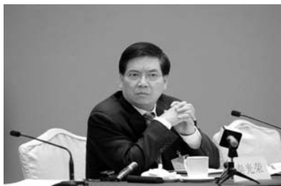
图为 2012 年 3 月 10 日， 秦光荣参加两 会时接受采访

到云南任职后，云南一直有人向中央告秦的严重的贪污腐败的状。2008 年 12 月，云南省马关县原都龙锡矿的退休干部和广大职工群众，联名向胡温举报时任云南省省长秦光荣的巨大贪污腐败信，是公之于世的。