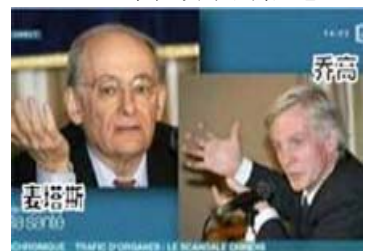
图：2010年1月7日，收视率很高的法国电视5台专题报道，揭露中共活体摘取大量法轮功学员器官进行贩卖的罪行。

《九评共产党》一书真实深刻地揭露了中共的邪恶本质，截至2012年7月11日，已有1亿1千9百多万中国民众在海外大纪元网站声明退出中共党、团、队（三退）。其中不乏中共各级党政官员，高等院校的教授、学者、学生等。