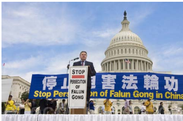
■ 2012 年 7 月 12 日，华盛顿美国国会前，法轮功学员举行集会，呼吁解体中共、停止迫害法轮功、声援 1.2 亿三退。图为美国国会议员在发言。

自二零零六年有证人披露活摘法轮功学员器官在中国大规模发生以来，多方独立调查证实这个骇人听闻的罪恶确实存在。二零一二年二月六日，原重庆市公安局局长王立军闯入美国驻成都领事馆寻求政治避难未遂，薄熙来图谋篡权败露被查处。媒体披露在王立军交给美国政府的各类中共机密文件中，包括中共活体摘取法轮功学员器官的证据。七月十二日的集会中，多位演讲嘉宾都严词谴责了中共活摘器官的罪恶。