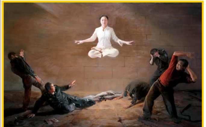
新唐人第二届油画大赛金奖作品《真相/震撼》