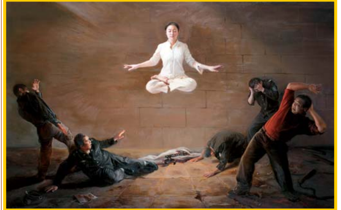
新唐人第二届油画大赛金奖作品《真相/震撼》